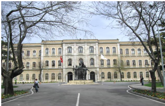
دانشگاه استانبول ترکیه

دانشگاه استانبول یکی از قدیمی‌ترین دانشگاه‌های دولتی ترکیه و جهان محسوب می‌شود و برای اولین بار به عنوان